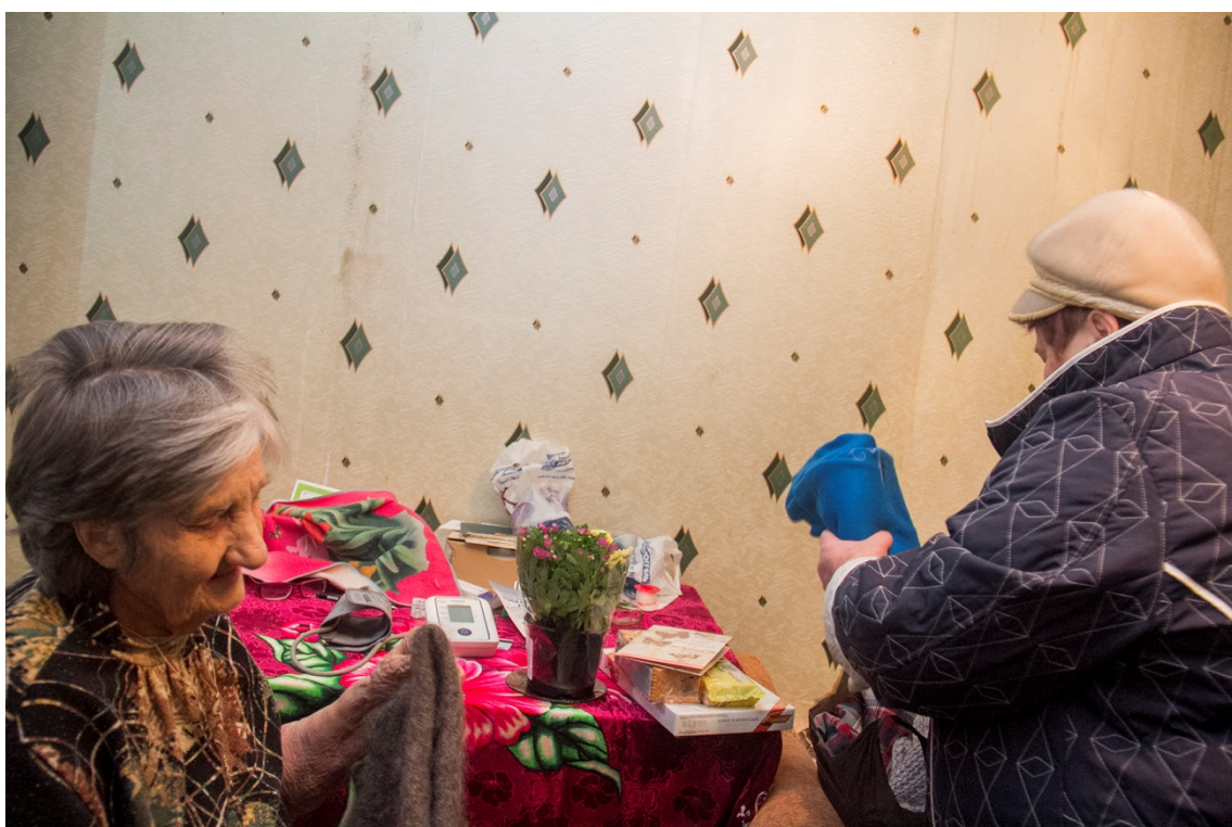
Оказание материальной помощи ветерану Великой Отечественной войны