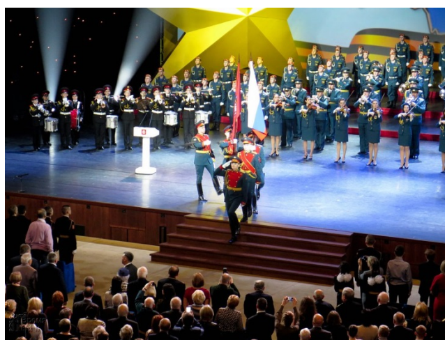
Концерт, посвященный Дню Героев Отечества «Здравствуй, страна героев!»