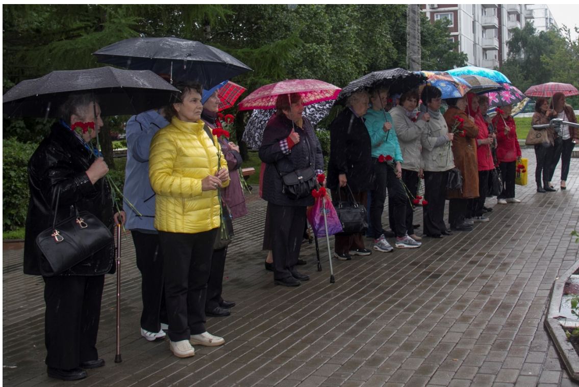
Парк Победы. 22 июня. Торжественный митинг.