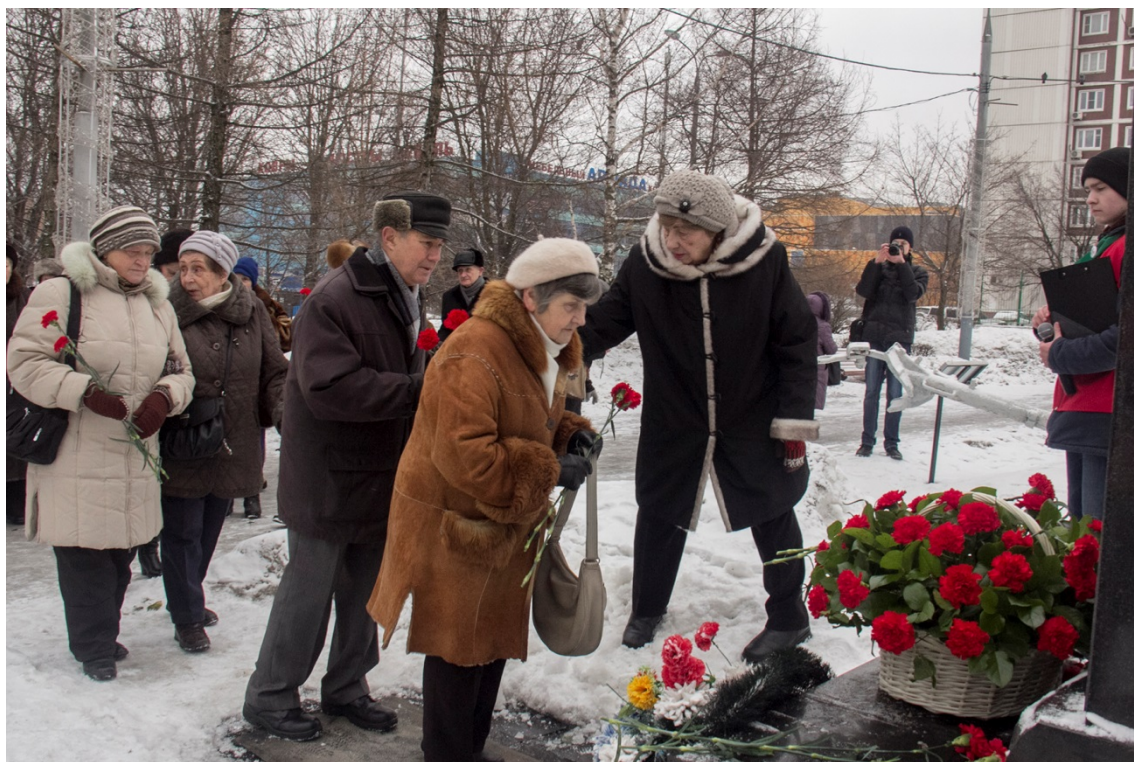
Возложение венков к памятнику защитника Отечества