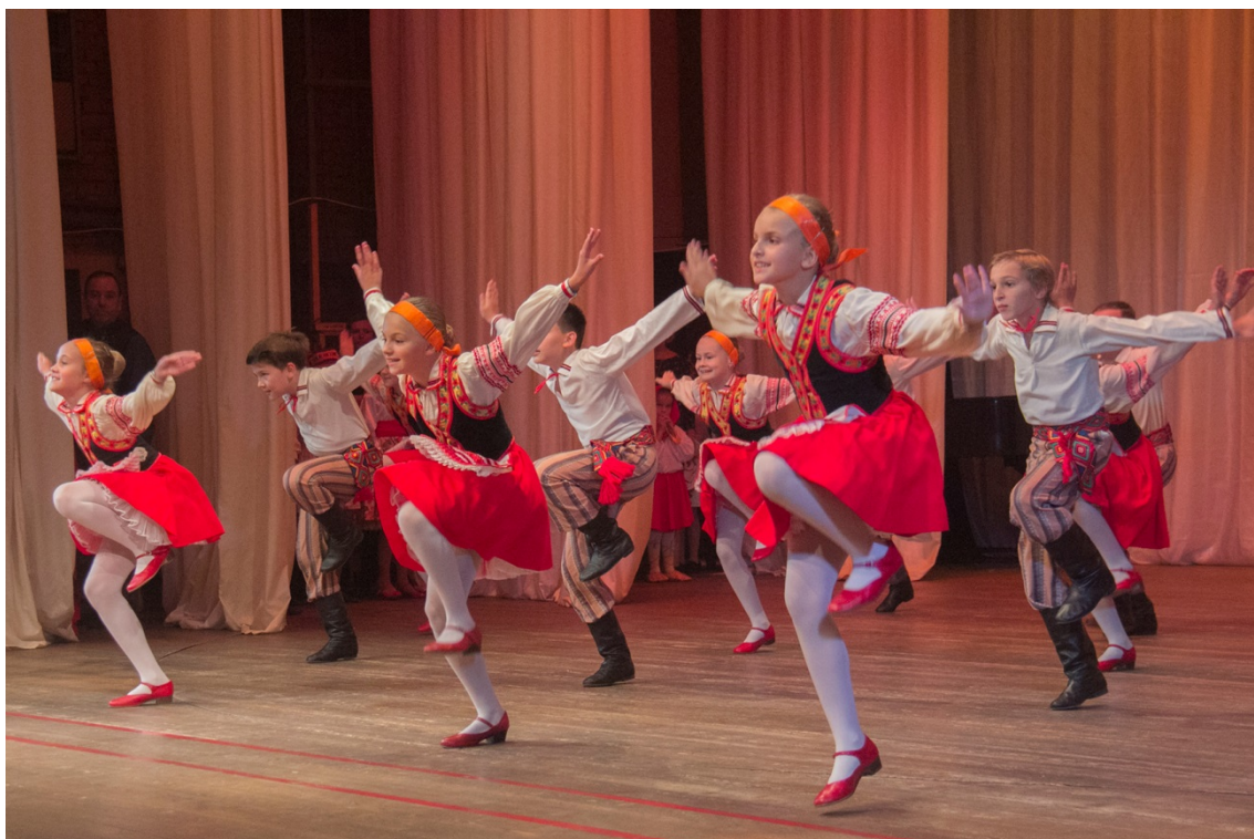
В Творческом Центре "Москворечье" состоялось праздничное мероприятие, посвященное Международному дню пожилого человека.