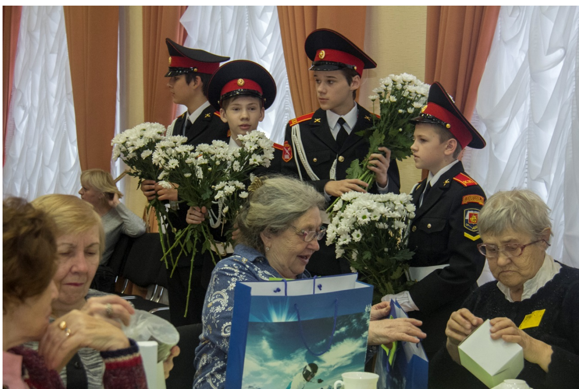
Бал юбиляров в школе 879