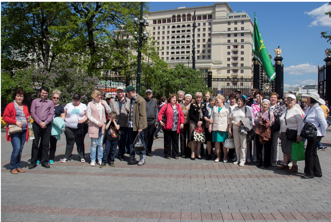
День славянской письменности и культуры