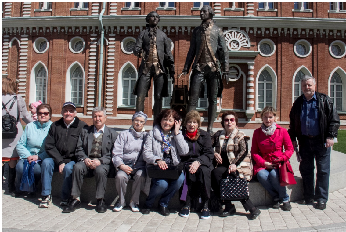
Префектура ЮАО и Государственный историко-архитектурный, художественный и ландшафтный музей-заповедник Царицыно пригласили ветеранов Чертаново Центральное на праздничное мероприятие, посвященное Дню Великой Победы.