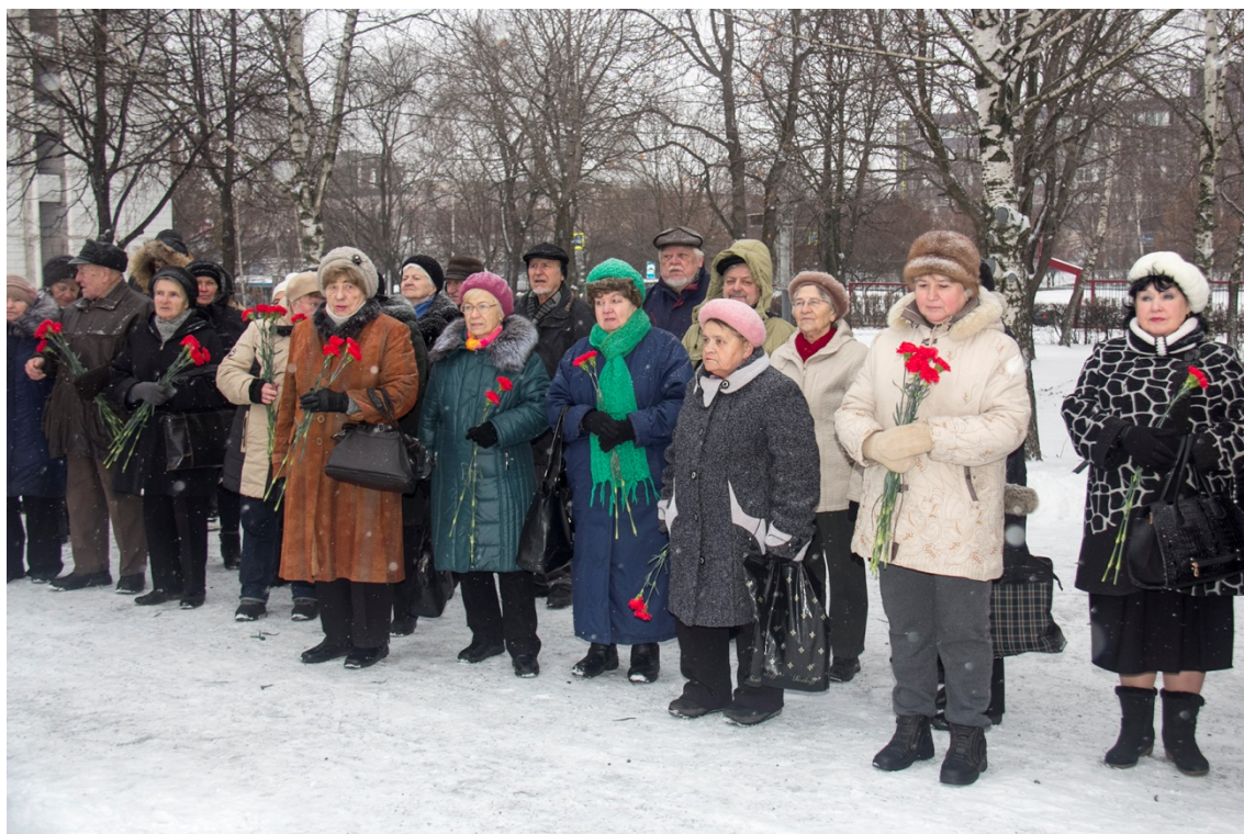
В Парке 30-летия Победы 5 декабря состоялось военно-патриотическое мероприятие «От героев былых времен».