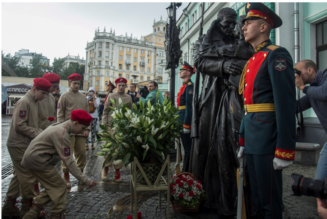
Общественно-патриотическая акция «Москва. Белорусский вокзал. 22 июня 1941 года».