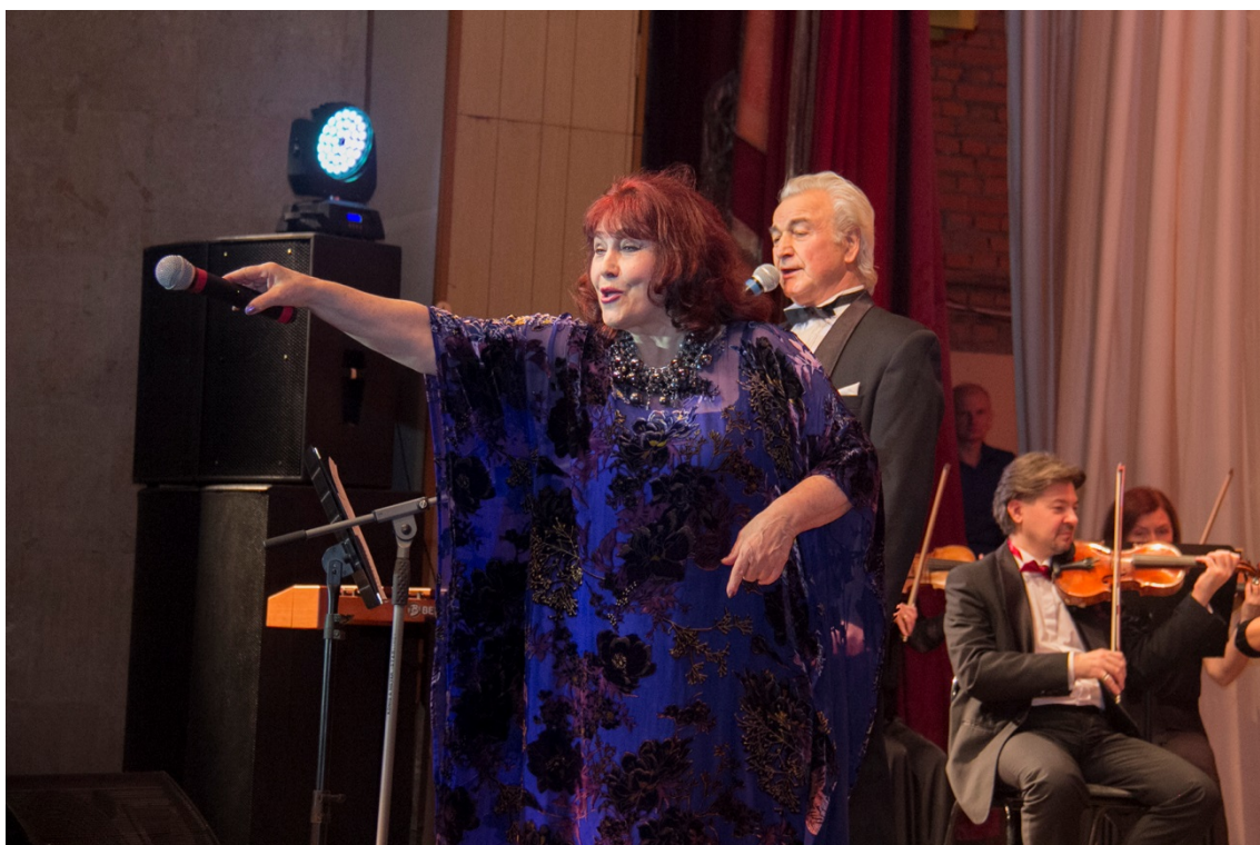
Праздничный концерт, посвященный Дню Матери