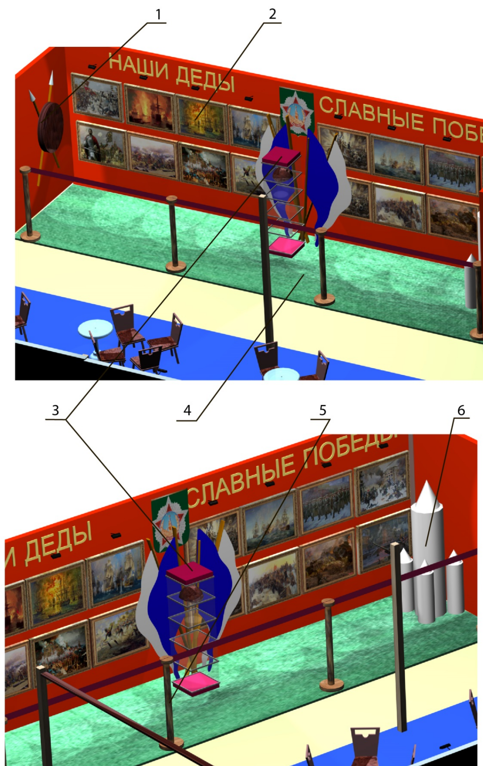
Рис 5. Картинная галерея «Наши деды – славные победы»