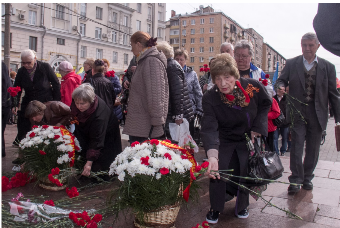
Торжественный митинг в честь Победы, метро Автозаводская