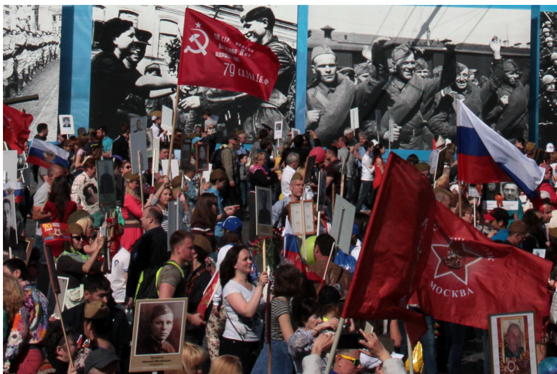
Бессмертный полк - подвиг народа