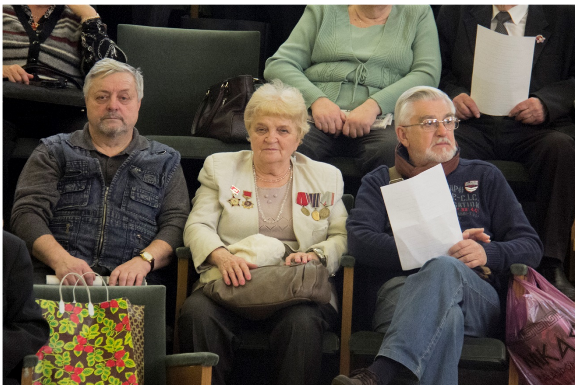
17 октября 2017 года в Круглом зале Префектуры ЮАО состоялась научная конференция, посвященной 100-летию Великой Октябрьской социалистической Революции