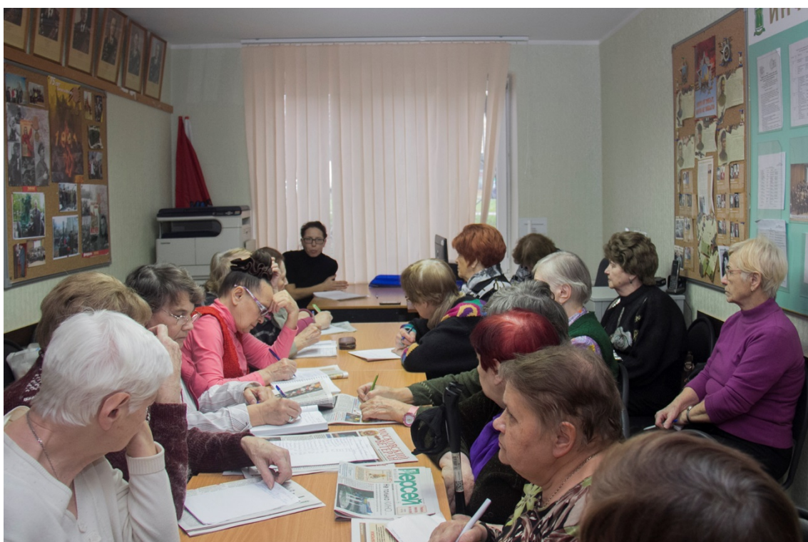
Лекция "Сахарный диабет"