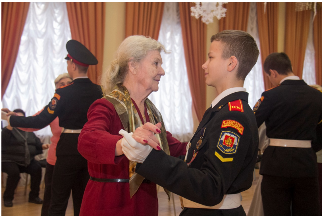
Новогодний бал в школе 879