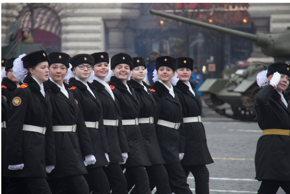
7 ноября 2017 года торжественный марш прошел в столице уже в юбилейный 15-й раз.