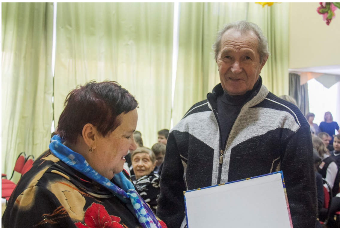
Поздравление с юбилеем члена совета ветеранов