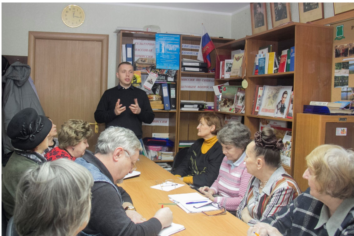
Лекция о безопасности. Читает сотрудник финансовой организации