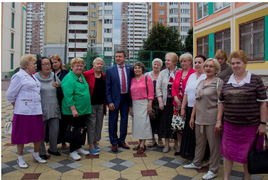
25 июля 2017 года состоялась встреча с председателем Комитета Госдумы по безопасности и противодействию коррупции Анатолием Выборновым