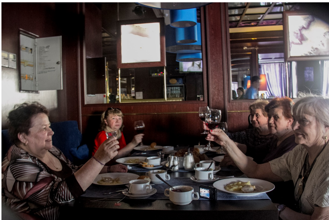
Окружной Совет ветеранов организовал для районных советов экскурсию в древний город Коломну