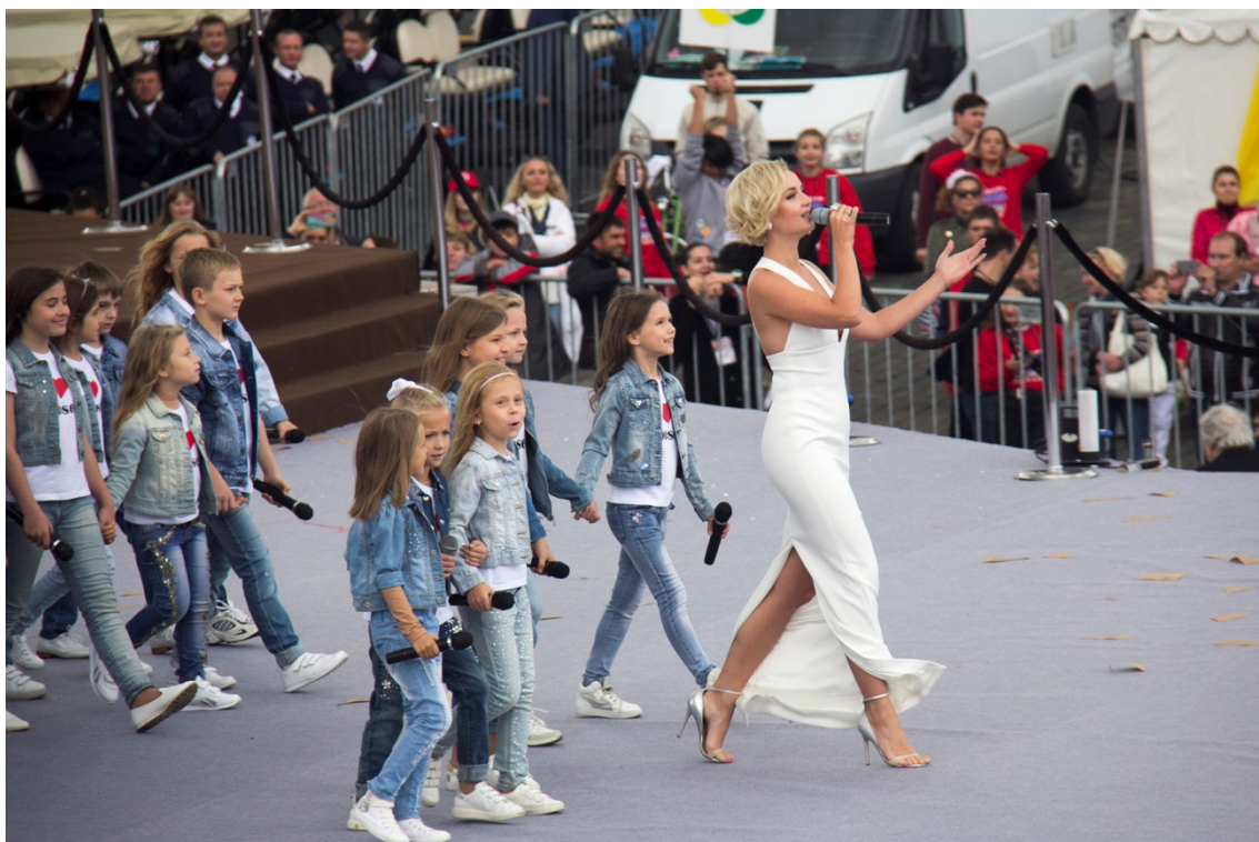
На Красной площади прошла торжественная церемония открытия Дня города,