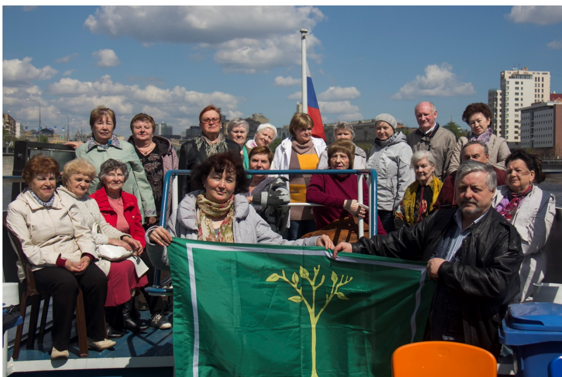
Экскурсия на теплоходе