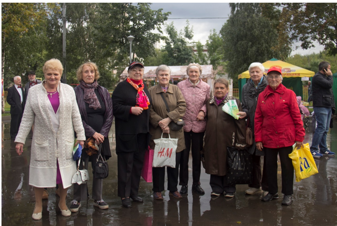
Торжественное открытие Парка 30-летия Победы после реконструкции